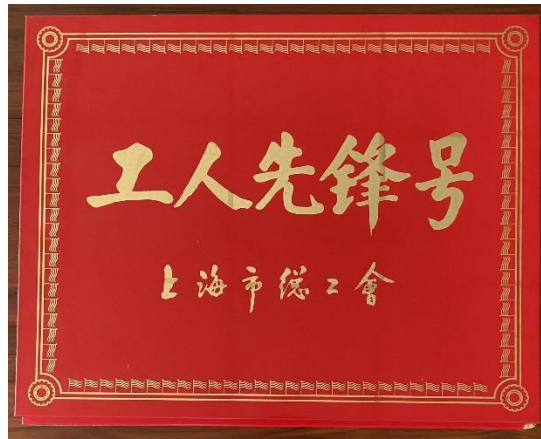
公司荣获“上海市工人先锋号”